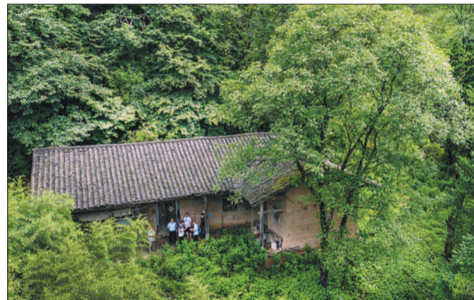
▶游人在参观当年深山中的姚家植树造林居住的土屋(7月12日无人机拍摄)。