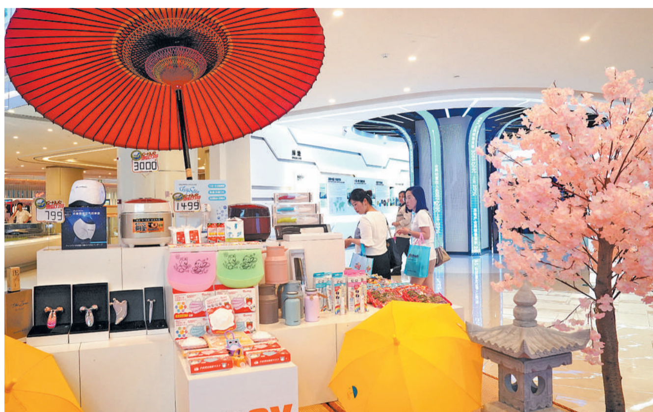
7月25日, 顾客在上海绿地全球商品贸易港的日本馆选购进口商品。