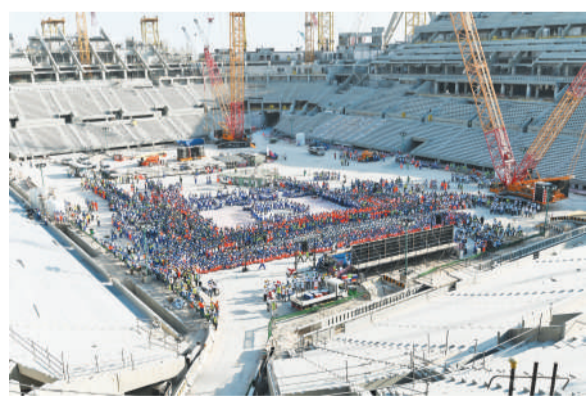
由中国铁建承建的卢赛尔体育场。

本报阿布扎比电 记者王俊鹏报道:2022年卡塔尔世界杯8座体育场累计施工达2亿工时,目前项目进展顺利。