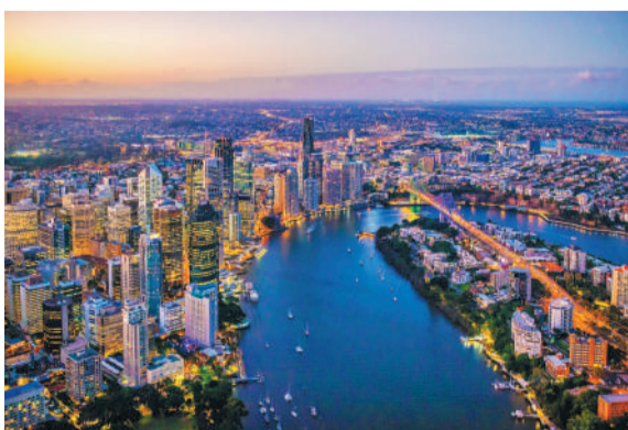
图为美丽的布里斯班。