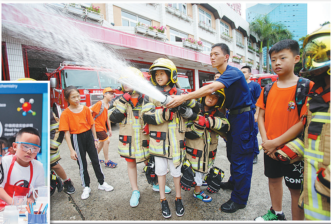
上图 在福建省厦门市消防支队特勤一中队营区内，小学生在消防员的指导下体验手持水枪“灭火”。

从睁开眼睛那一刻起，到三岁进入幼儿园之前，一个孩子所接受的教育几乎都来源于家庭；孩子上学之后，也有一半时间是在家里度过。换句话说，孩子人生的第一课来自家庭教育，而家庭教育的关键是父母。 有意思的是，驾驶机动车上路必须要考驾照，可养育一个孩子长大成才，父母却不需要事先进行任何培训。第一次做父母的人们往往是抱着孩子时才发现问题，养育孩子是一门需要大量专业知识和耐心的工作。 到底应该怎么教育孩子，才能帮他们扣好人生第一颗扣子？