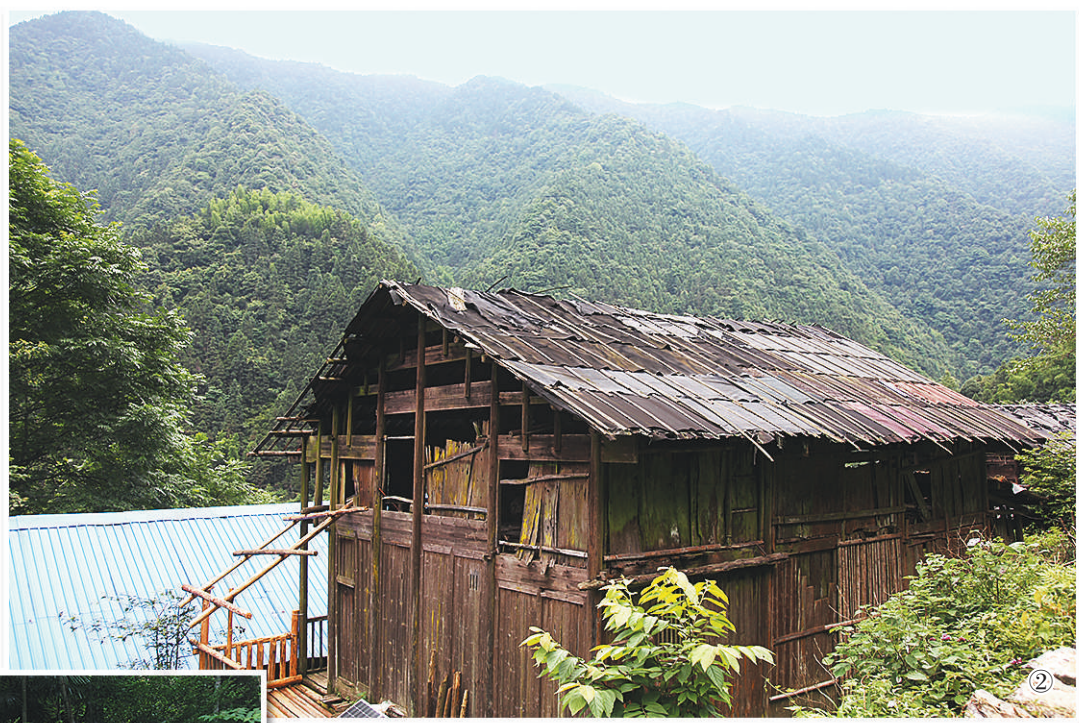
① 兰老二当年使用过的刺刀。 ② 空树岩村失散红军住过的木头房子。 ③ 陡矿河边埋葬兰老二的小树林。