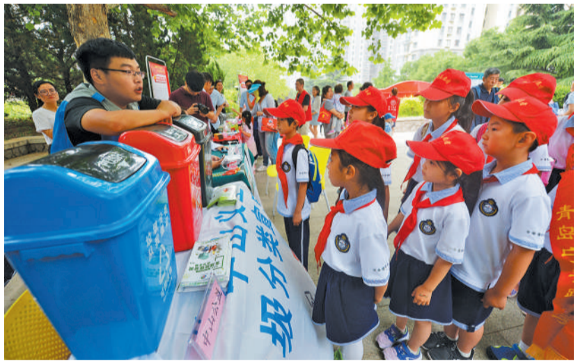
6月28日,在山东省青岛市“VR+5G”数字化党群服务e站活动现场,宁安路小学学生学习垃圾分类知识。