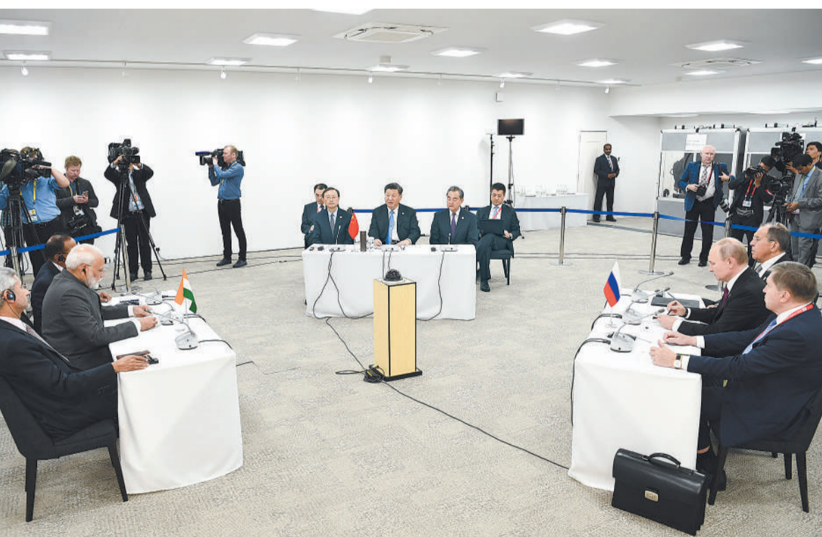
6月28日,国家主席习近平在大阪出席中俄印领导人会晤,同俄罗斯总统普京、印度总理莫迪就当前国际形势、重大国际和地区问题、三方合作深入交换意见。

本报大阪6月28日电 记者苏海河 陈建报道:国家主席习近平28日在大阪出席中俄印领导人会晤,同俄罗斯总统普京、印度总理莫迪就当前国际形势、重大国际和地区问题、三方合作深入交换意见。三国领导人一致同意,继续维护好、利用好、发展好中俄印合作机制,为促进地区乃至世界和平、稳定、繁荣作出更大贡献。