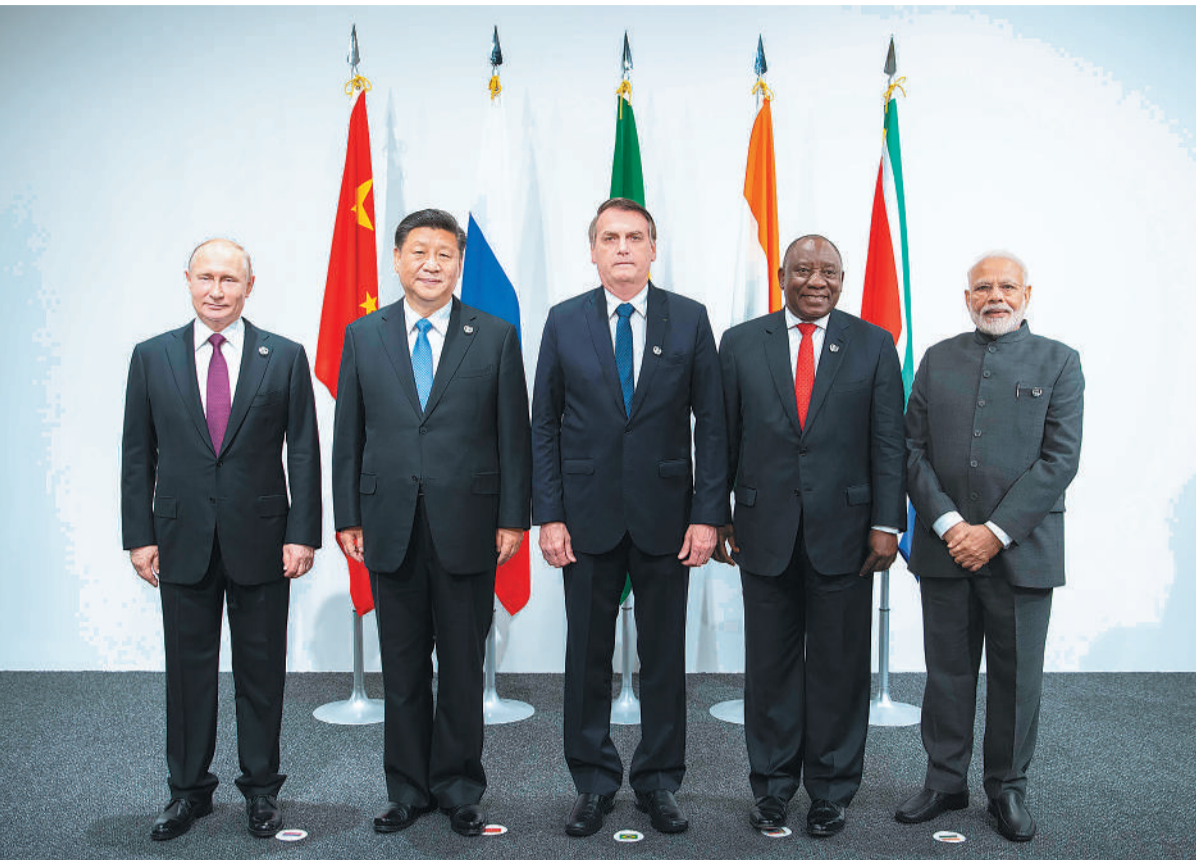
6月28日,金砖国家领导人会晤在大阪举行。国家主席习近平、巴西总统博索纳罗、俄罗斯总统普京、印度总理莫迪、南非总统拉马福萨出席。

与会非方领导人表示,中方主办这次中非领导人会晤,充分体现了对非洲的重视和非中间的亲密关系。去年召开的中非合作论坛北京峰会和刚刚在北京举行的北京峰会成果落实协调人会议十分成功。非中合作务实、高效,以行动为导向,有强有力的后续保障机制,很好回应了非洲国家的现实需求。 (下转第三版)