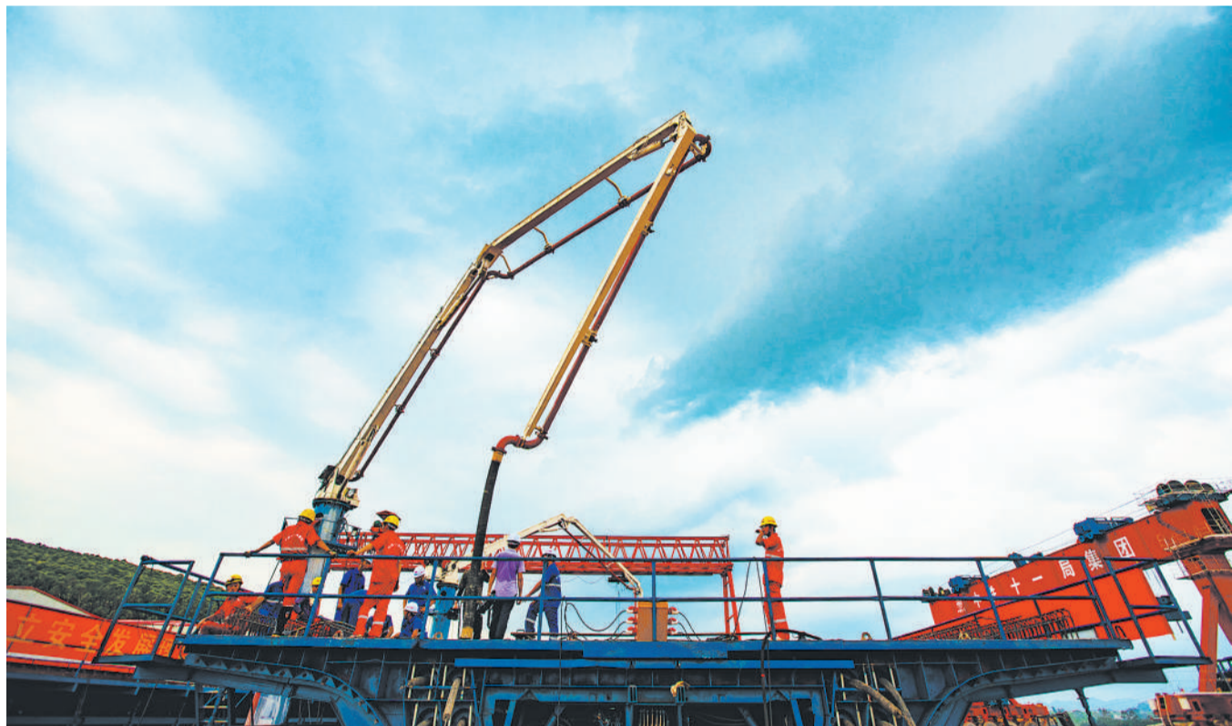
南崇高铁全线首片箱梁成功浇筑

据悉，金山大道互通立交桥将于7月中旬正式开通。目前，武汉已完成的军运会保障工程量超过80%，预计8月底前将陆续开通。