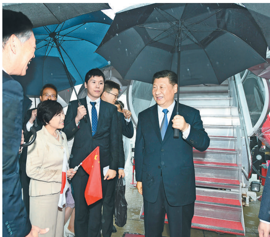
6月27日,国家主席习近平乘专机抵达大阪,应日本首相安倍晋三邀请,出席二十国集团领导人第十四次峰会。日本政府高级官员、大阪府知事等在舷梯旁迎接。

本报大阪6月27日电 记者苏海河 陈建报道:国家主席习近平27日乘专机抵达大阪,应日本首相安倍晋三邀请,出席二十国集团领导人第十四次峰会。 当地时间下午1时15分许,习近平乘坐的专机抵达大阪关西国际机场。习近平步出舱门,日本政府高级官员、大阪府知事等在舷梯旁迎接。 丁薛祥、刘鹤、杨洁篪、王毅、何立峰等陪同人员同机抵达。 中国驻日本大使孔铤佑也到机场迎接。 本次二十国集团领导人峰会将于6月28日至29日在大阪举行。习近平将在峰会上深入阐述对世界经济形势和全球经济