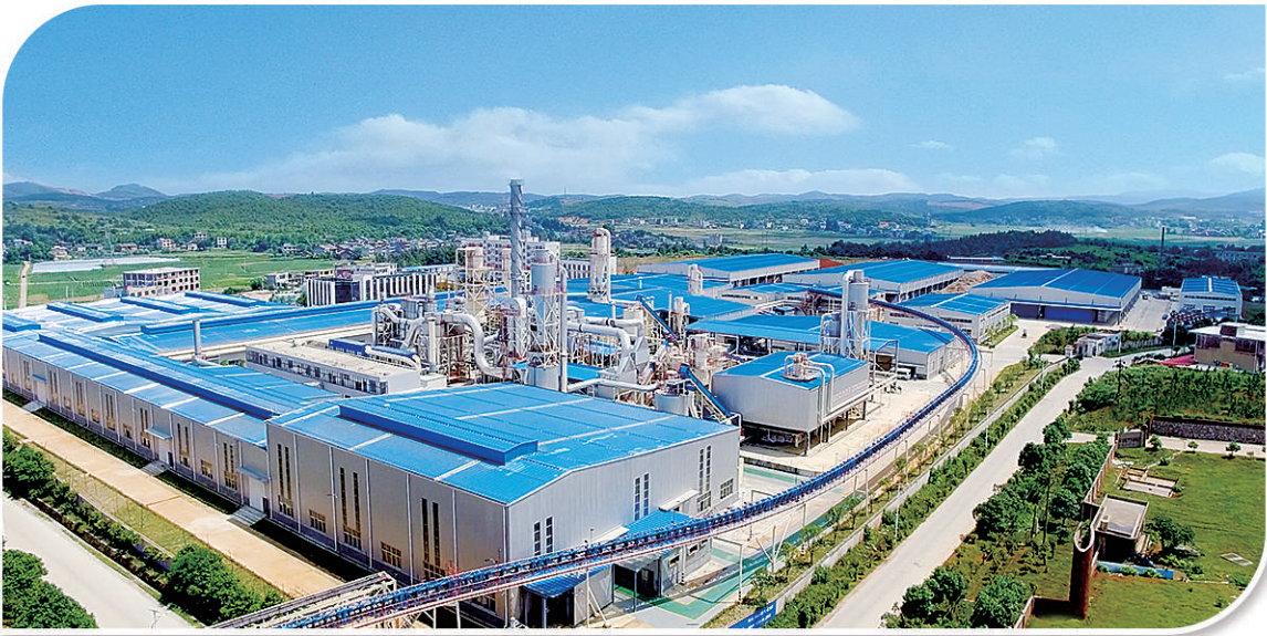
上图 湖南粮食集团投资6.5亿元建设独具特色的循环经济产业园,引进德国迪芬巴赫公司生产的“全球首条连续压机秸秆板生产线”。

今年是粮食产业经济发展“连抓三年、紧抓三年”的第三年。两年多来,各地集中出台了一批政策含金量高、扶持力度大的举措,推动粮食产业高质量发展。各省逐步将粮食产业高质量发展纳入粮食安全省长责任制考核,进一步压实责任、正确导向,确保政策措施落细落实。围绕实施国家粮食安全战略,推动粮食供求平衡向高水平跃升,积极防范化解粮食领域重大风险,为保障国家粮食安全提供强力支撑。