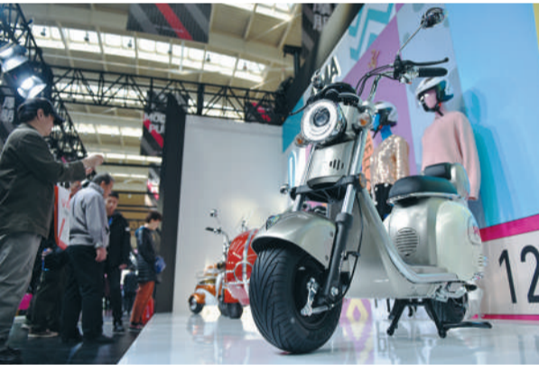
在天津举行的中国北方国际自行车电动车展览会上，一系列最新的两轮电动车产品引得参观者驻足。

当前，随着电动车新国标正式落地实施，两轮电动车行业产业升级势在必行。针对两轮电动车升级需求，国家有关部门也在加快电池标准化问题研究，推进动力电池充换电技术的应用和推广。在行业内部，目前共享换电已作为一种高效的标准化解决方案被提出，国内不少企业与城市已开展换电模式的商业化运营尝试和探索。