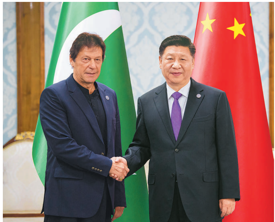
6月14日,国家主席习近平在比什凯克会见巴基斯坦总理伊姆兰·汗。

本报比什凯克6月14日电 记者廖伟径 李逸远报道:国家主席习近平14日在比什凯克会见巴基斯坦总理伊姆兰·汗。