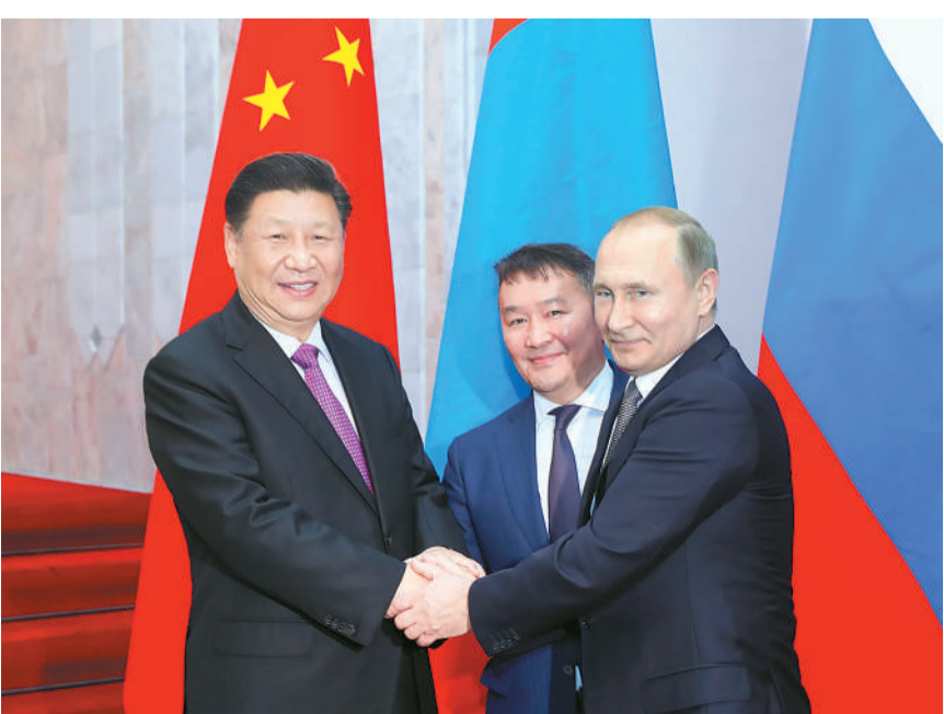
6月14日,国家主席习近平在比什凯克同俄罗斯总统普京、蒙古国总统巴特图勒嘎举行中俄蒙三国元首第五次会晤。

本报比什凯克6月14日电 记者廖伟径 李逸远报道:国家主席习近平14日在比什凯克同俄罗斯总统普京、蒙古国总统巴特图勒嘎举行中俄蒙三国元首第