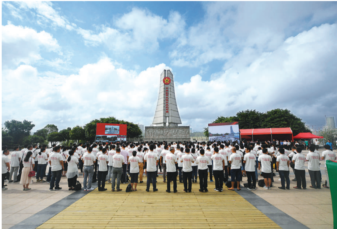
6月11日,“壮丽70年·奋斗新时代——记者再走长征路”主题采访活动启动仪式在江西于都举行。新华社记者 周 密摄

6月11日上午,在中央红军长征集结出发地江西于都河畔,在江西瑞金市叶坪巍峨的红军烈士纪念馆塔前,在福建汀汀县素有“红军长征第一村”之称的中复村,在福建宁化县红军长征出发地纪念馆广场,“壮丽70年·奋斗新时代——记者再走长征路”主题采访活动同时启动,来自全国30多家媒体的500多名记者参加启动仪式。