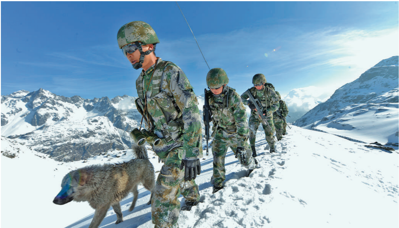
西藏军区海拔4687米的卓拉哨所官兵“五一”期间在执勤。

在这个被称为生命禁区的地方,哨兵们无时不战备,无日不练兵。他们坚信,只有练就坚强的体魄和过硬的本领,才能