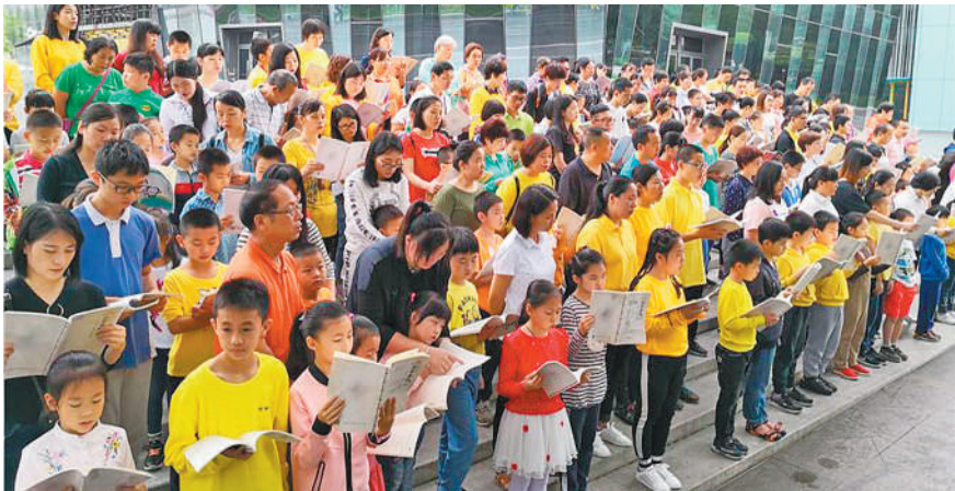
习学书院组织的公益经典能量诵读活动现场。