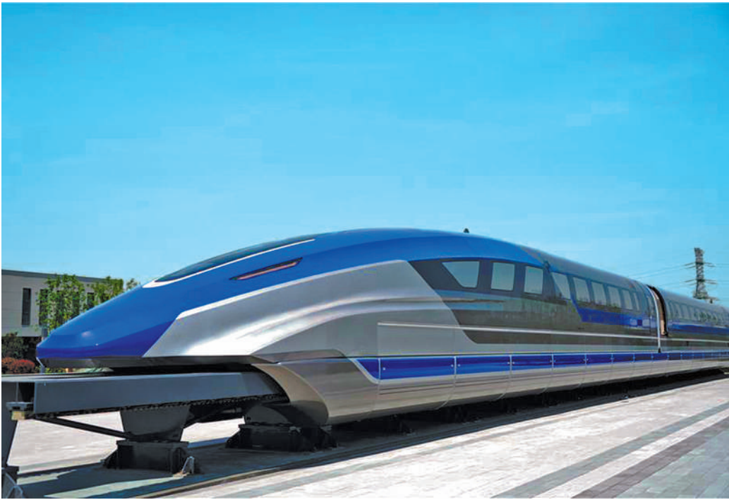
图为时速600公里高速磁浮试验样车。目前，高铁最高运营速度为350公里/小时，飞机巡航速度为800—900公里/小时，时速600公里的高速磁浮列车可以填补高铁和航空运输之间的速度空白。