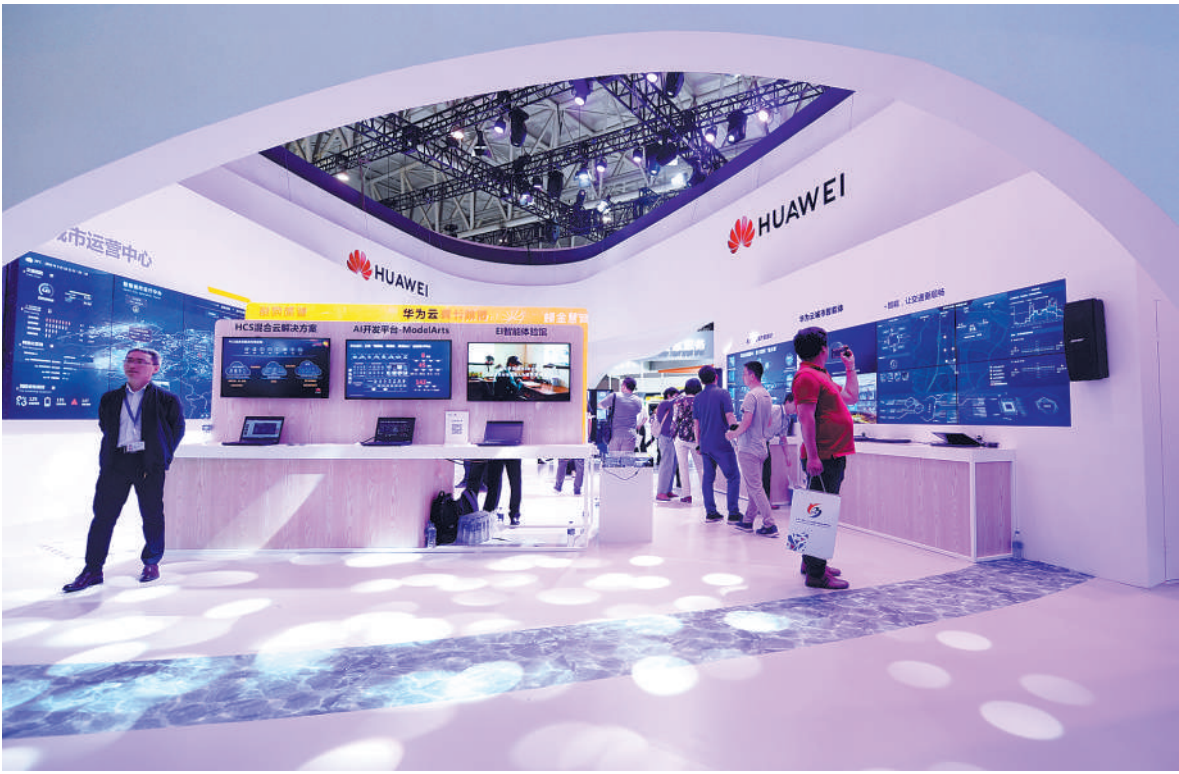
一季度,我国高技术产业增加值同比增长7.8%,增速高于全部规模以上工业1.3个百分点。图为观众在天津第三届世界智能大会智能科技展华为展台参观(5月16日摄)。

来自科技部火炬中心的数据显示,今年1月至2月,我国168家国家高新区企业实现营业收入4.9万亿元,同比增长9.3%;实际上缴税费2909.6亿元,同比增长12.4%;营