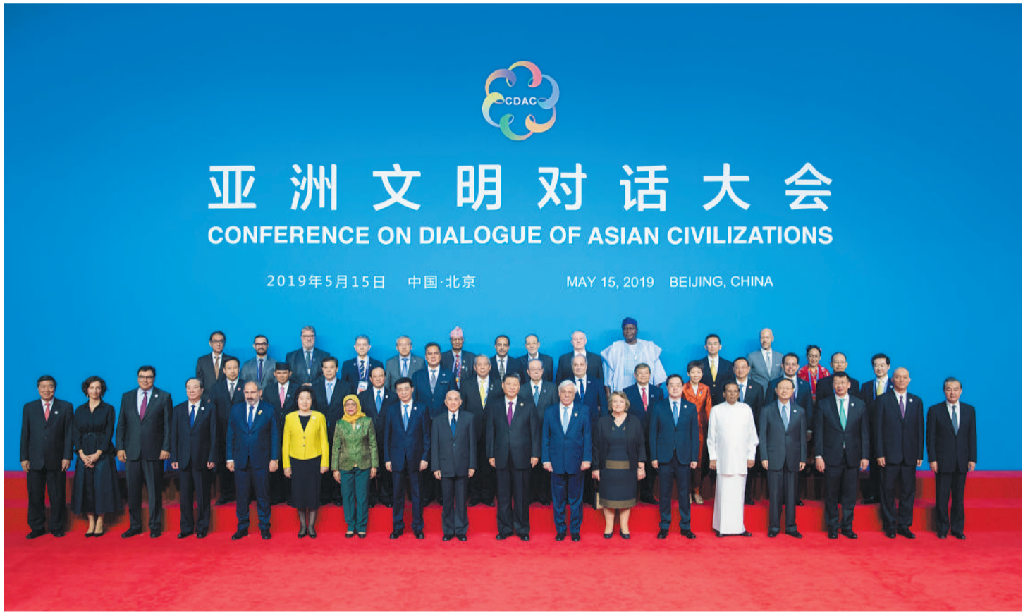
5月15日,国家主席习近平在北京国家会议中心出席亚洲文明对话大会开幕式,并发表题为《深化文明交流互鉴 共建亚洲命运共同体》的主旨演讲。