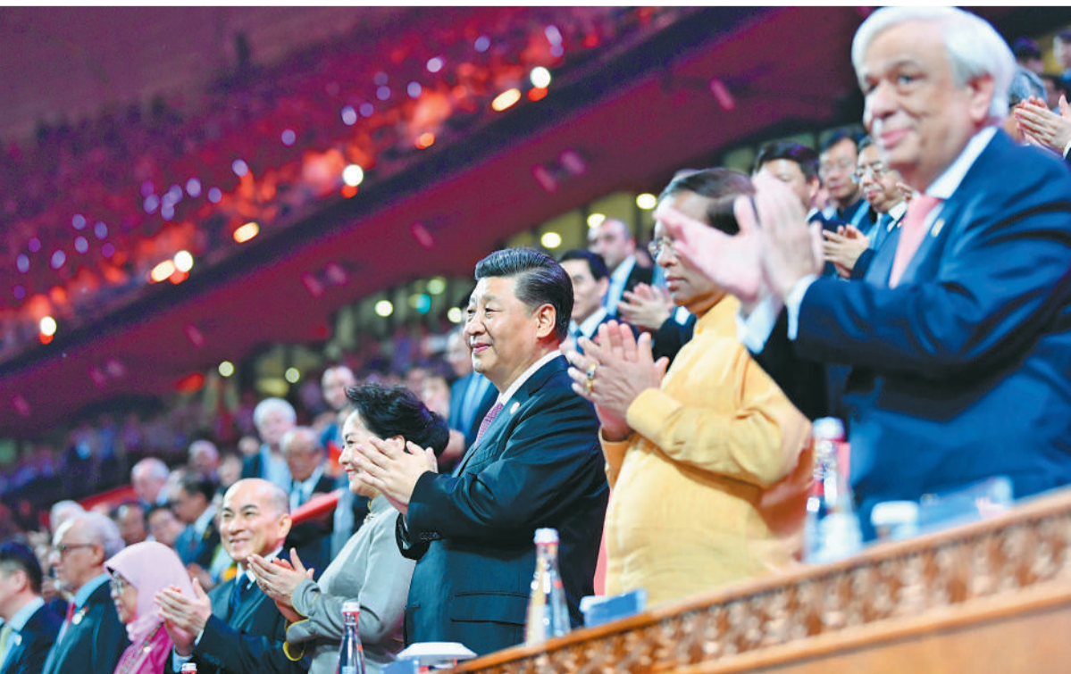
5月15日晚,国家主席习近平和夫人彭丽媛在北京国家体育场同出席亚洲文明对话大会的外方领导人夫妇共同出席亚洲文化嘉年华活动。新华社记者 殷博古摄 (详见二版)

在亚洲文明对话大会开幕式上,习近平主席把握各种文明交流互鉴的大势、立足不同思想文化相互激荡的现实,明确提出“坚持相互尊重、平等相待”“坚持美人之美、美美与共”“坚持开放包容、互学互鉴”“坚持与时俱进、创新发展”的四点主张。这一重要讲话,为实现亚洲人民共同期待指明了方向,必将使亚洲各国在合作发展、共筑命运共同体的道路上走得更加坚定。