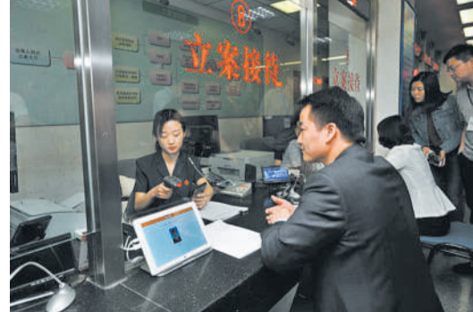
网约当事人在办理立案手续。(资料图片)

据悉，北京法院“立体化线上立案系统”试运行一年来，通过网上预约立案、微信预约立案、京津冀跨域立案及微信快速立案共完成线上立案100361件，占全市法院一审民事、首次执行案件的29.2%。