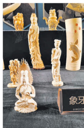
△ 上海海关查获的走私濒危动植物及其制品。