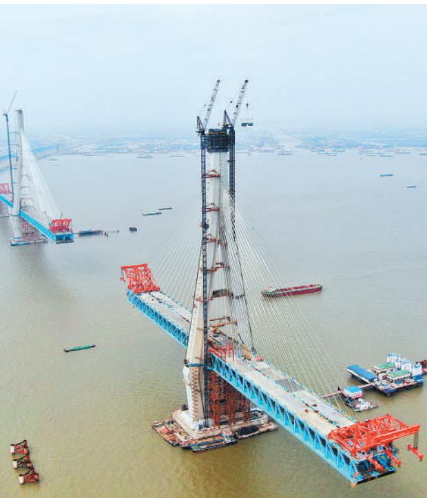
5月8日,中铁大桥局施工人员在沪通长江大桥南主塔29号墩施工,当日主塔高度达305.5米,预计南主塔7月封顶。沪通长江大桥是沪通(上海—江苏南通)铁路段的跨长江控制性工程。