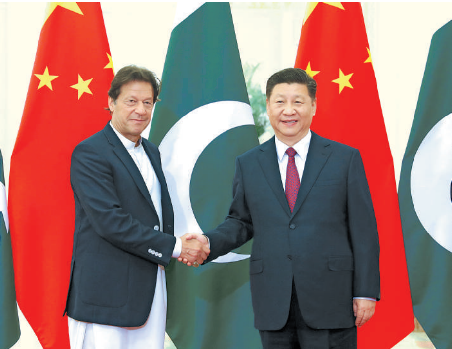
4月28日，国家主席习近平在北京人民大会堂会见巴基斯坦总理伊姆兰·汗。