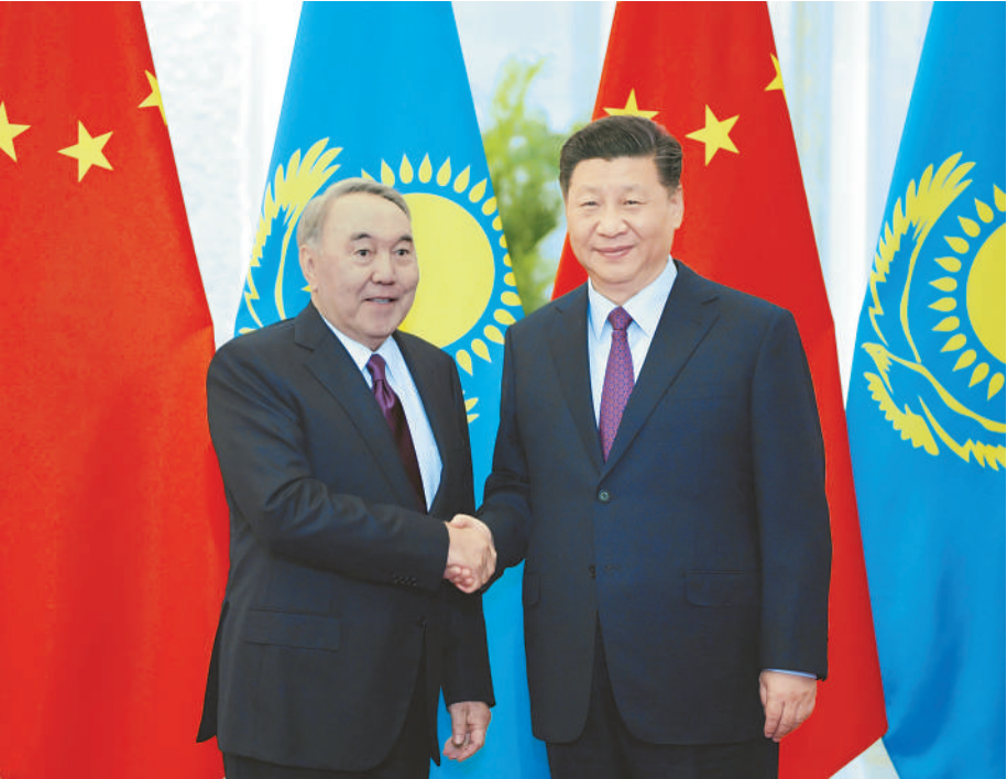
4月28日，国家主席习近平在北京人民大会堂会见哈萨克斯坦首任总统纳扎尔巴耶夫。