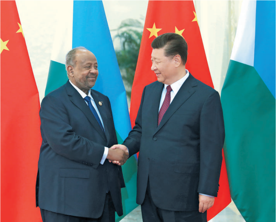
4月28日，国家主席习近平在北京人民大会堂会见吉布提总统盖莱。