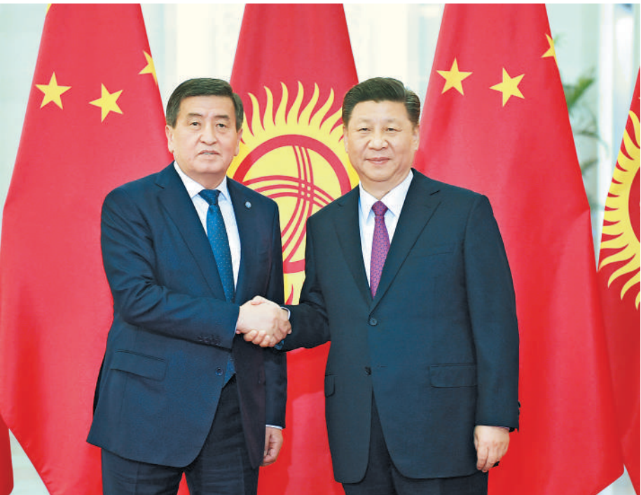
4月28日，国家主席习近平在北京人民大会堂会见吉尔吉斯斯坦总统热恩别科夫。