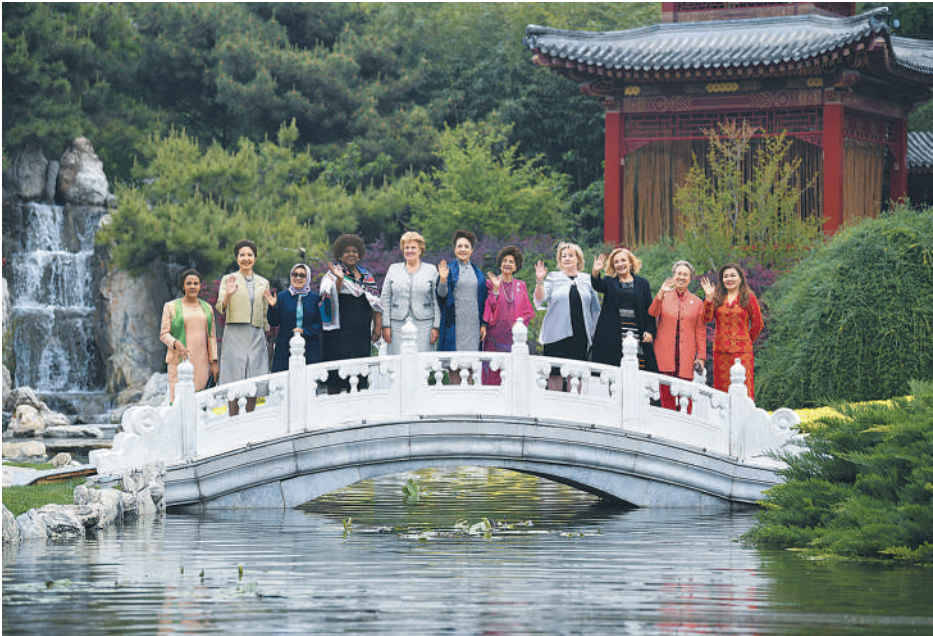
4月27日，国家主席习近平夫人彭丽媛在北京钓鱼台国宾馆邀请出席第二届“一带一路”国际合作高峰论坛的外方领导人配偶欣赏中国昆曲和京剧表演。