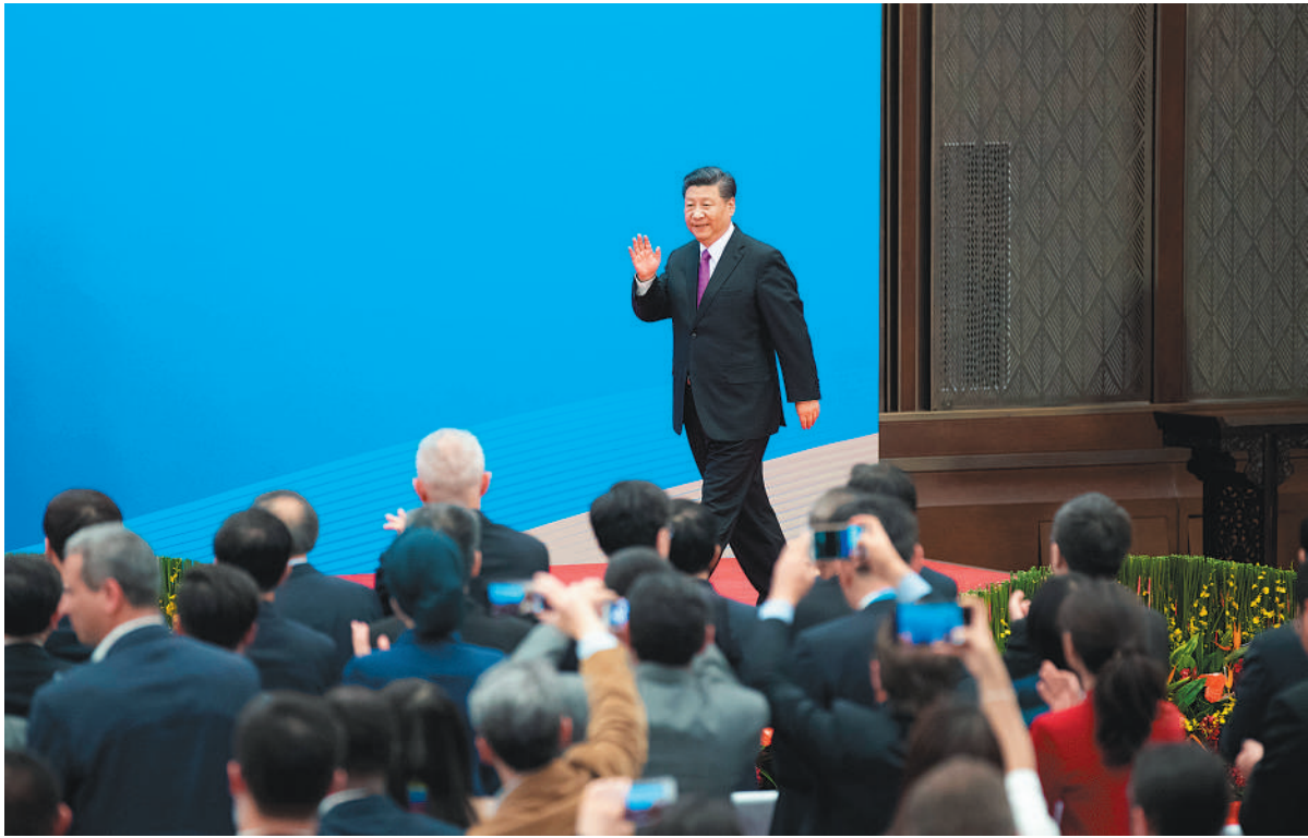
4月27日，第二届“一带一路”国际合作高峰论坛在北京雁栖湖国际会议中心举行圆桌峰会，国家主席习近平主持会议并致开幕辞。圆桌峰会闭幕后，习近平会见中外记者，介绍第二届“一带一路”国际合作高峰论坛圆桌峰会情况和主要成果。这是习近平步入记者会现场。