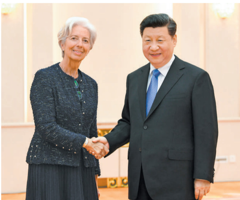
4月24日，国家主席习近平在北京人民大会堂会见国际货币基金组织总裁拉加德。