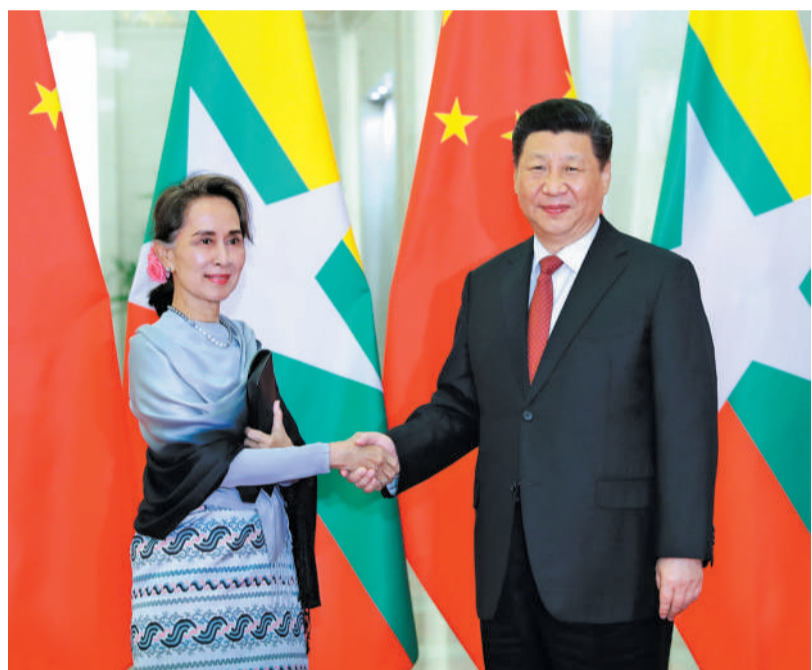
4月24日，国家主席习近平在北京人民大会堂会见缅甸国务资政昂山素季。