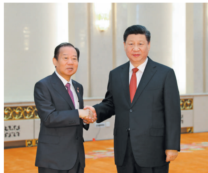
4月24日，国家主席习近平在北京人民大会堂会见日本首相特使、自民党干事长二阶俊博。

时光流淌千年，不改丝路之缘。植根古丝绸之路的沃土，传承古丝绸之路的精神，2013年，习近平主席西行哈萨克斯坦、南下印度尼西亚，提出共建“丝绸之路经济带”和“21世纪海上丝绸之路”的重大倡议。一个关于构建人类命运共同体、推动世界共同繁荣发展的“21世纪最大的故事”，从此起笔肇画。以创新合作为笔墨，以共谋发展为气韵，它贯穿着复兴中国对变革世界的时代担当。饱含东方智慧与天下情怀的理念在波澜壮阔的实践中不断升华，散发出宏阔睿智的思想魅力，赢得了国际社会的广泛认同与期许。