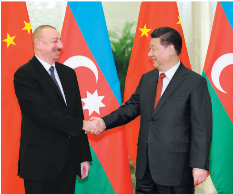
4月24日，国家主席习近平在北京人民大会堂会见阿塞拜疆总统阿利耶夫。