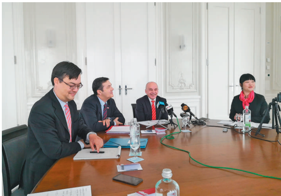
瑞士联邦主席毛雷尔(左三)在瑞士首都伯尔尼宫接受采访。

“一带一路”倡议面向未来，体现了经济全球化趋势，将为世界经济带来新的纬度，堪称百年大计，各方应尽力促成该倡议实现，使其最终造福于世界人民和全球经济