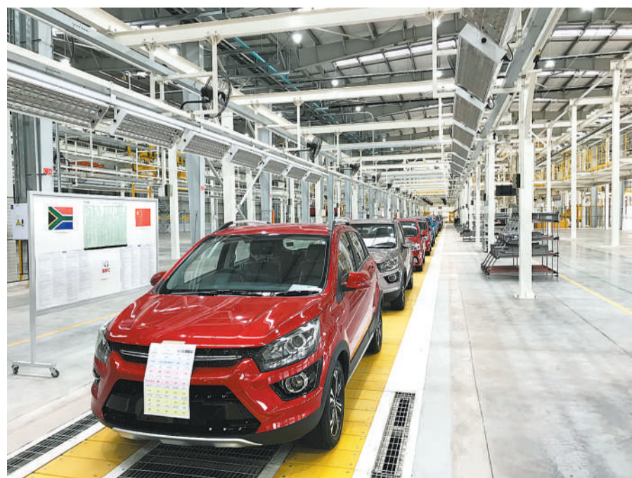
图为北汽南非本地组装生产的汽车下线。

2016年8月30日，工厂奠基开工。此后，南非工厂建设驶入“快车道”。按计划，2019年底建成包括涂装、焊装、总装三大工艺在内的现代化汽车生产工厂，具备5万台年生产能力。目前，工厂正处于