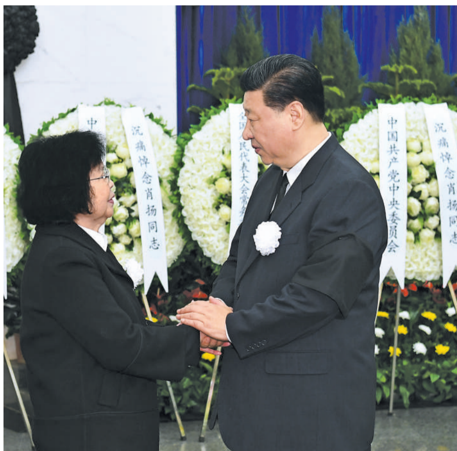
4月22日,肖扬同志遗体在北京八宝山革命公墓火化。习近平、李克强、栗战书、汪洋、王沪宁、赵乐际、韩正、王岐山等前往八宝山送别。这是习近平与肖扬亲属握手,表示深切慰问。

习近平李克强栗战书汪洋王沪宁赵乐际韩正王岐山等到八宝山革命公墓送别 肖扬同志病重期间和逝世后,习近平李克强栗战书汪洋王沪宁赵乐际韩正王岐山江泽民胡锦涛等同志,前往医院看望或通过多种形式对肖扬同志逝世表示沉痛哀悼并向其亲属表示深切慰问