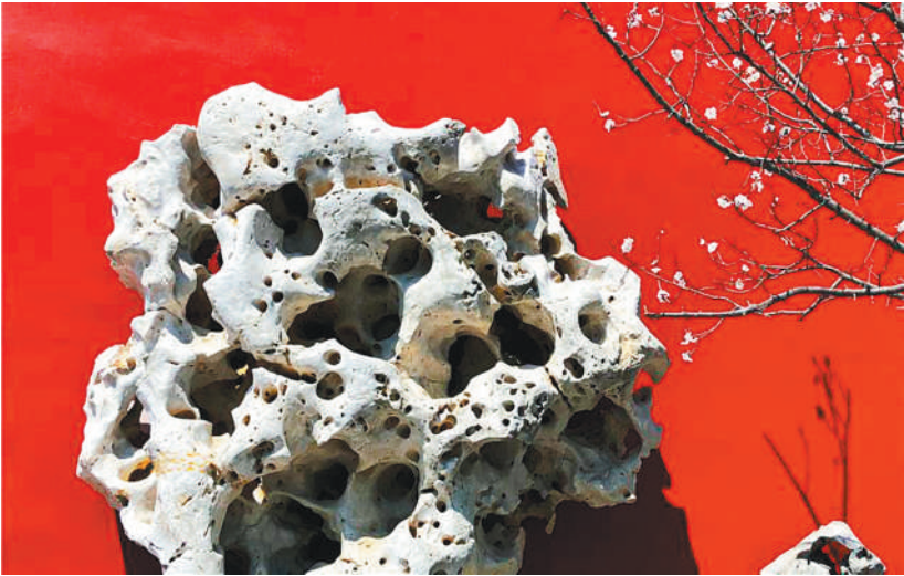
北京园一景。

园区景观分区，在不同空间多形式地展示一二年生花卉、宿根花卉、球根花卉及水生花卉，在整个展期内突出市花月季和菊花。同时，展示苔草、委陵菜等本地野生地被花卉，一串红、三色堇等北京科研育种成果及天竺葵、木茼蒿、矮牵牛等国外引种筛选出的适合北京推广品种，以花卉为载体突出北京园林科研创新成果应用。