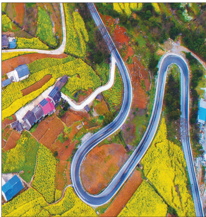
湖北省兴山县昭君镇，油菜花竞相绽放。近年来，该县依靠当地优势资源，大力发展景区游、乡村旅游，助力当地农民增收致富。