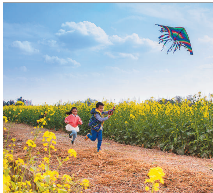
四川省成都市双流区黄水镇，2名孩童在开心地放风筝。近年来，双流区着力打造农旅产业，助农增收。