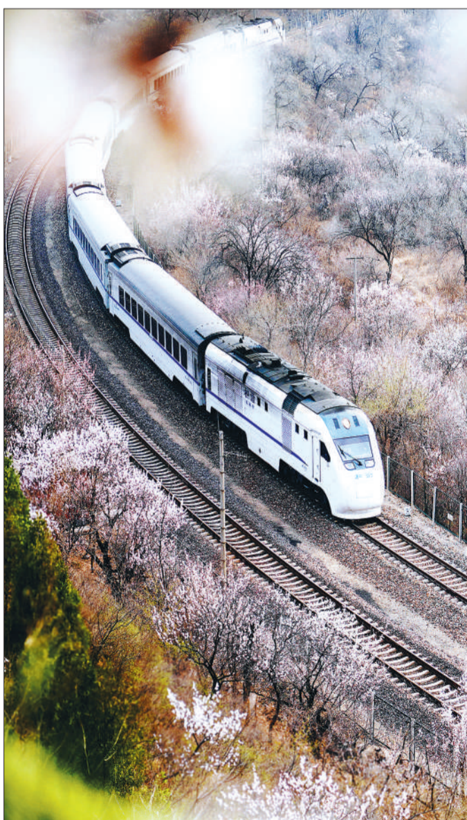
北京市昌平区居庸关长城脚下，春花满山遍野，S2线和和谐号列车行驶在花海中。