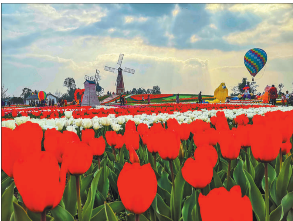
四川省遂宁市蓬溪县天福万象国际农博园里的郁金香竞相开放，迎来大批游客踏青赏花。