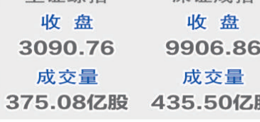
深证成指 收盘 9906.86 成交量 435.50亿股