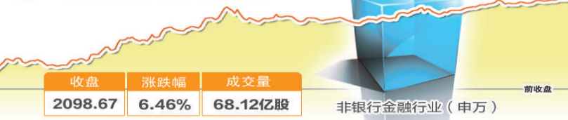
收盘 2098.67 涨跌幅 6.46% 成交量 68.12亿股