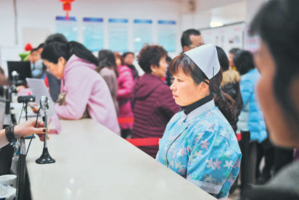
2月23日，在福建省妇联家庭关爱服务中心，家政求职者正在录入人脸信息。新华社记者 宋伟摄

今年以来，多地开始推行家政服务人员持证上岗制。为进一步规范家政行业，上海市今年将培训4万名家政员持证上门，同时已明确把家政立法纳入今年民生领域的正式立法项目。