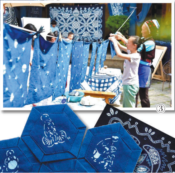
图① 游客在小白家的小院里体验扎染乐趣。