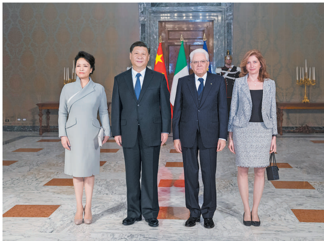
3月22日,国家主席习近平在罗马同意大利总统马塔雷拉举行会谈。会谈前,马塔雷拉总统为习近平举行隆重欢迎仪式。这是习近平和夫人彭丽媛同马塔雷拉总统和女儿劳拉合影。