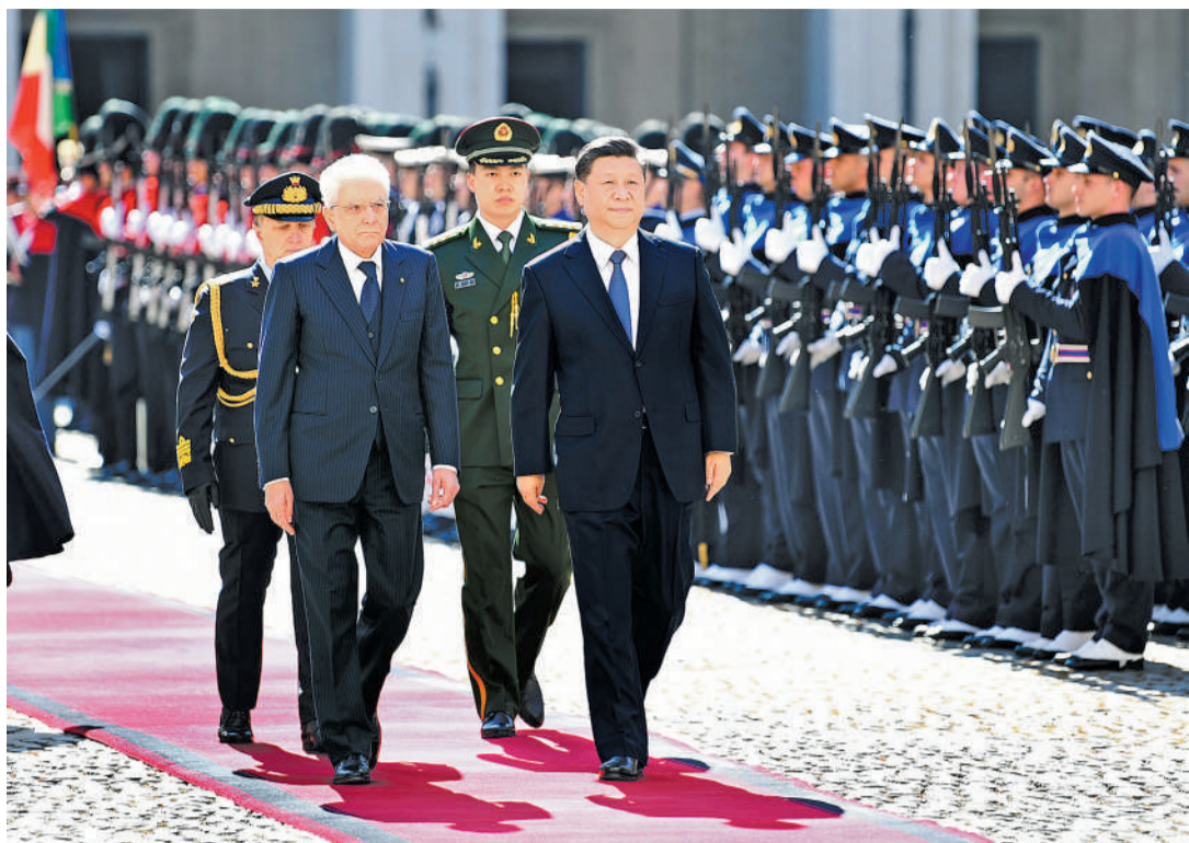
3月22日,国家主席习近平在罗马同意大利总统马塔雷拉举行会谈。会谈前,马塔雷拉总统为习近平举行隆重欢迎仪式。