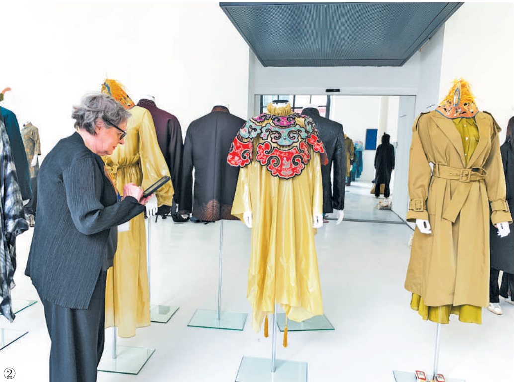
图① 意大利知名景点西班牙广场游人如织。 图② “设计中国”展览亮相罗马国立当代艺术博物馆。