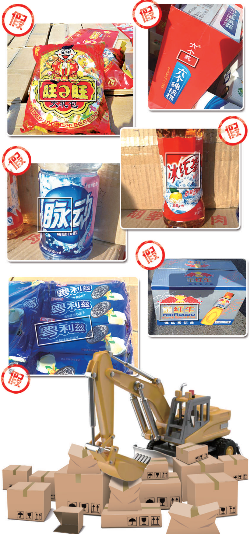
图中山寨食品为漯河市“春雷行动”发现的部分仿冒侵权食品和饮料。（资料图片）

斤29.49元，环比上涨14.1%，同比上涨5.3%。 从不同省份仔猪价格来看，河北、山西、辽宁、吉林、黑龙江、安徽、江西、山东、河南、湖北和山西等前期受疫情影响比较大的产区仔猪价格明显上涨。其中，辽宁省仔猪价格累计涨幅最高达97.4%。 “猪价上涨的主要动力来自供给端，尤其是受疫情影响的主产区猪价明显上涨。根据以往价格周期变动情况，仔猪价格到达底部预示着生猪价格将会步入上涨周期。2019年1月份达到本轮仔猪价格周期低点，这或许预示着猪价