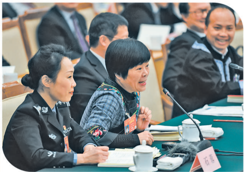
左图 十三届全国人大二次会议贵州代表团全体会议向媒体开放，全国人大代表吴明兰(前排左二)在发言。

姜有为代表表示，沈阳将努力营造人人是环境、处处是环境、时时是环境的浓厚氛围，以良好营商环境推动沈阳全面振兴、全方位振兴。