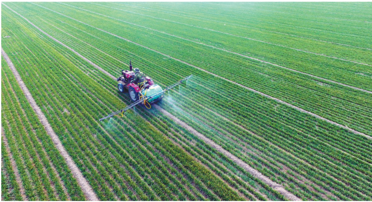
3月8日,山东省聊城市茌平县贾寨镇祥丰粮食种植家庭农场里,农民驾驶着拖拉机给小麦喷施除草剂(无人机拍摄)。当前,小麦主产区山东省小麦陆续进入返青期,当地粮食合作社、家庭农场、种粮大户抢抓农时,做好春季小麦田间管理,为夏粮丰收打下基础。