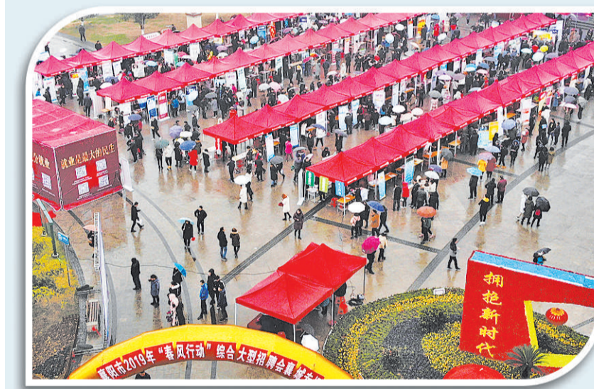
上图 2月16日，求职者招聘会上查看招聘信息。当日，河北武强县利用外出务工人员、大中专毕业生春节集中返乡的有利时机举办春季人才招聘会，全县42家规模以上企业进场招聘。