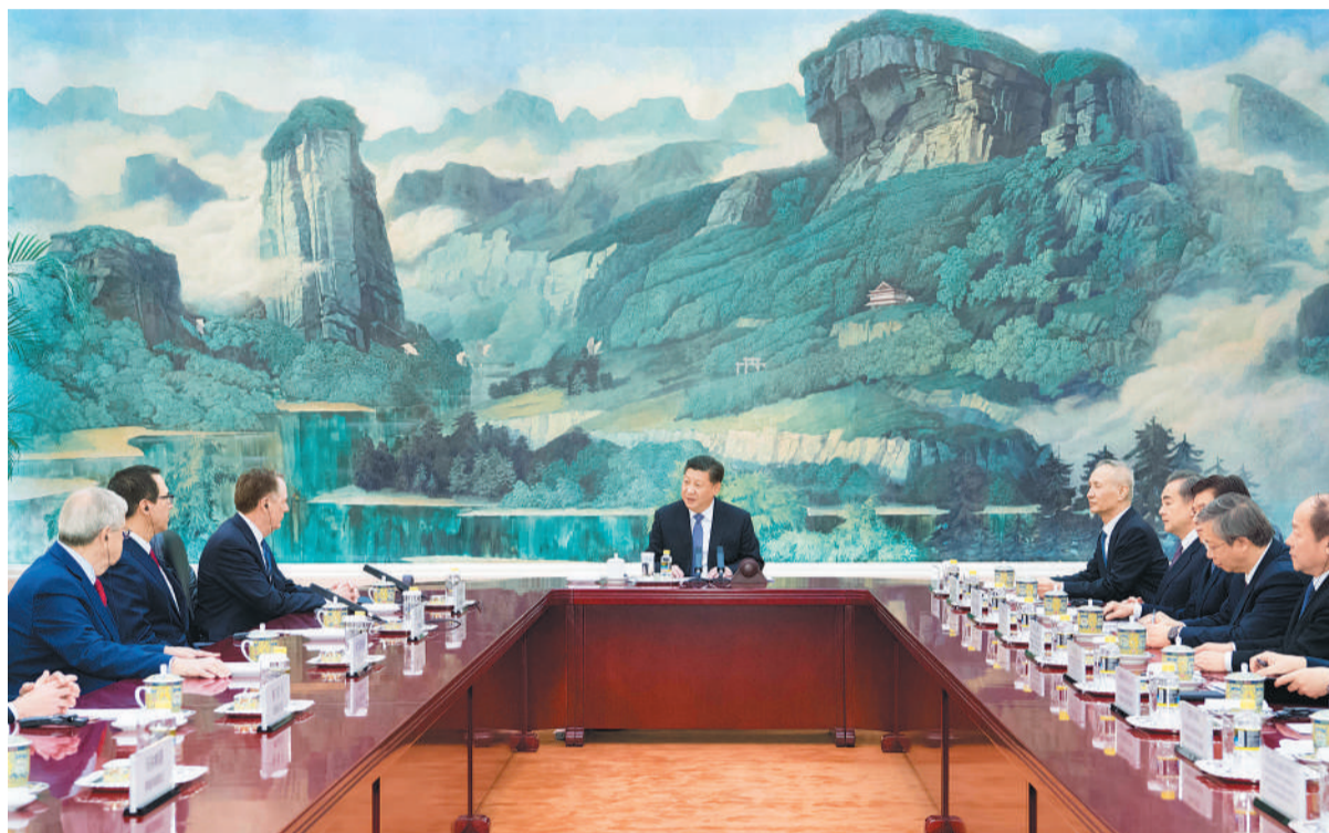
2月15日,国家主席习近平在北京人民大会堂会见来华进行新一轮中美经贸高级别磋商的美方贸易代表莱特希泽和财政部长姆努钦。

新华社北京2月15日电 (记者李忠发) 国家主席习近平15日在人民大会堂会见来华进行新一轮中美经贸高级别磋商的美方贸易代表莱特希泽和财政部长姆努钦。