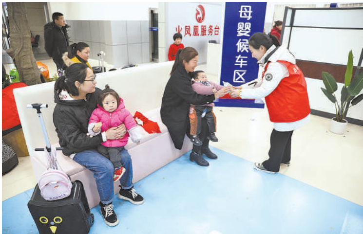
河南商丘站母婴候车区工作人员为带孩子的旅客做好服务。

该站温馨“换乘驿站”自春运开通以来,已接待普速列车和高铁之间换乘旅客500多人次。