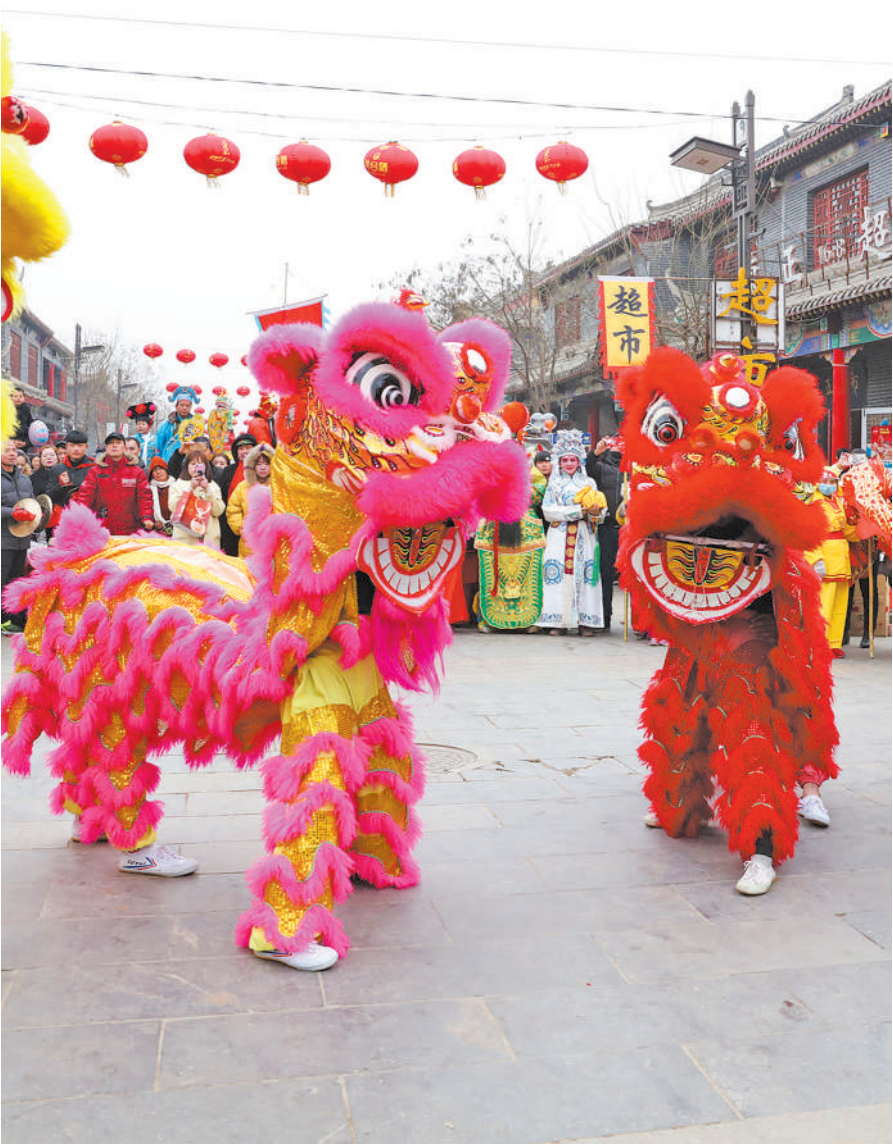
上图 2月10日，民间艺人在河北邯郸市广府古城庙会上表演舞狮。

春天播种,秋天收获。只要我们继续奔跑,真抓实干,当下的拼搏与奋斗,都将成为打开未来之门的钥匙,新的更大奇迹也必将在我们手中创造出来。