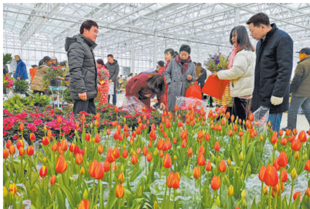
左图 春节期间，安徽滁州南谯区花鸟鱼虫市场，市民在选购鲜花绿植。