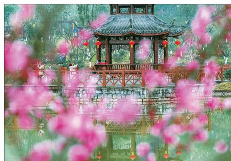
▲游客在重庆市南川区生态大观园梅花园里寻梅迎春。春节期间，园内梅花俏丽争春，娇艳动人。