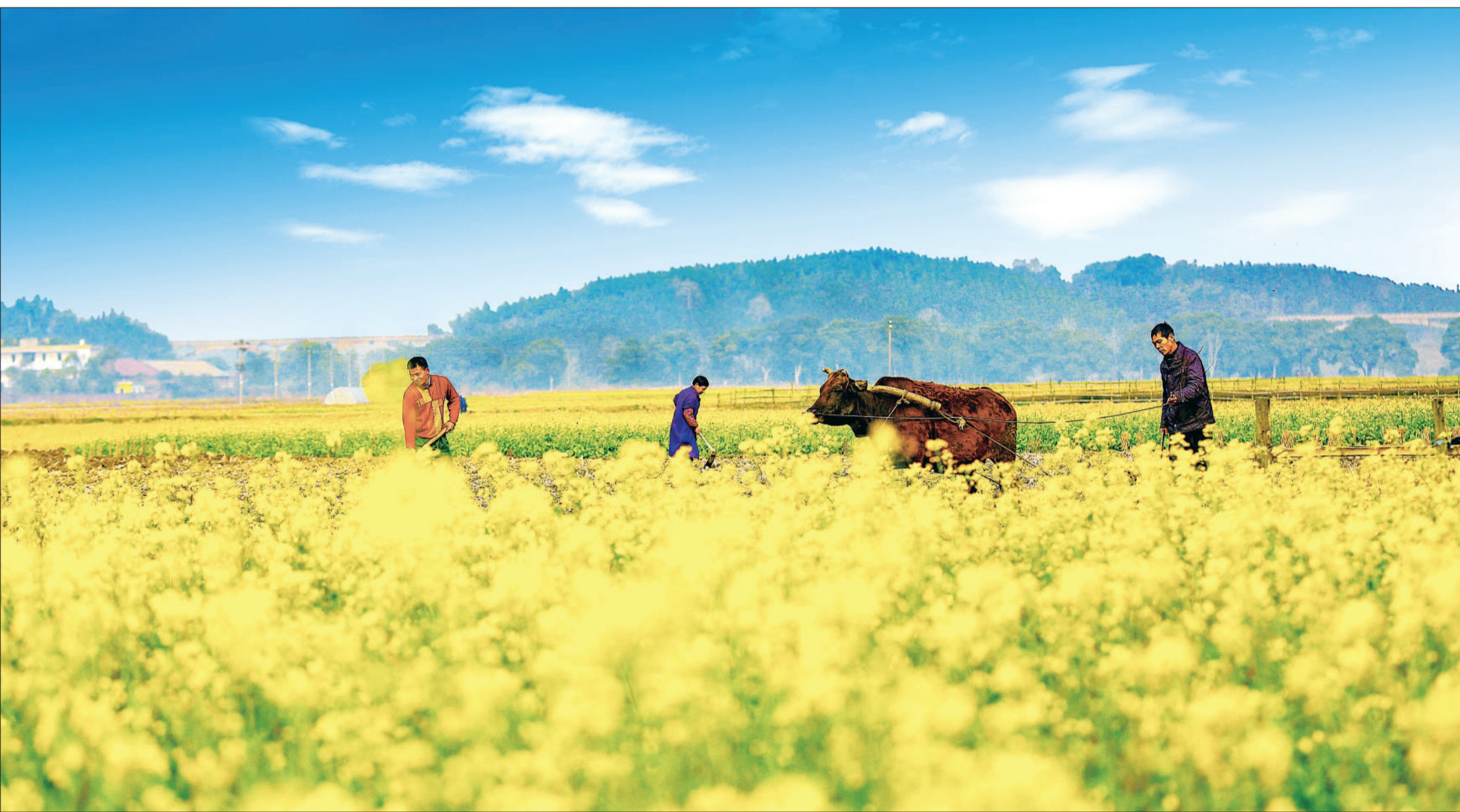
▲江西省峡江县金江乡，农民在田里忙生产。时下当地田间油菜花盛开，农民抢抓晴好天气翻耕起垄备春耕。