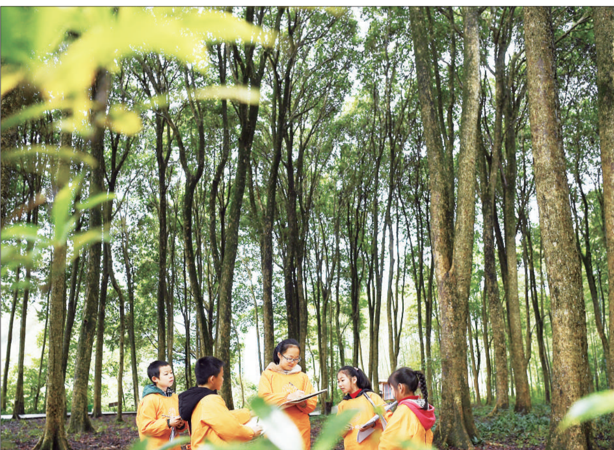
▲江西省宜春县桥西乡塔前金丝楠木林景区，放寒假的小学生在写生。该县境内有全国较为罕见的原生态金丝楠木林群，春节假期吸引大批游客前来旅游观光。