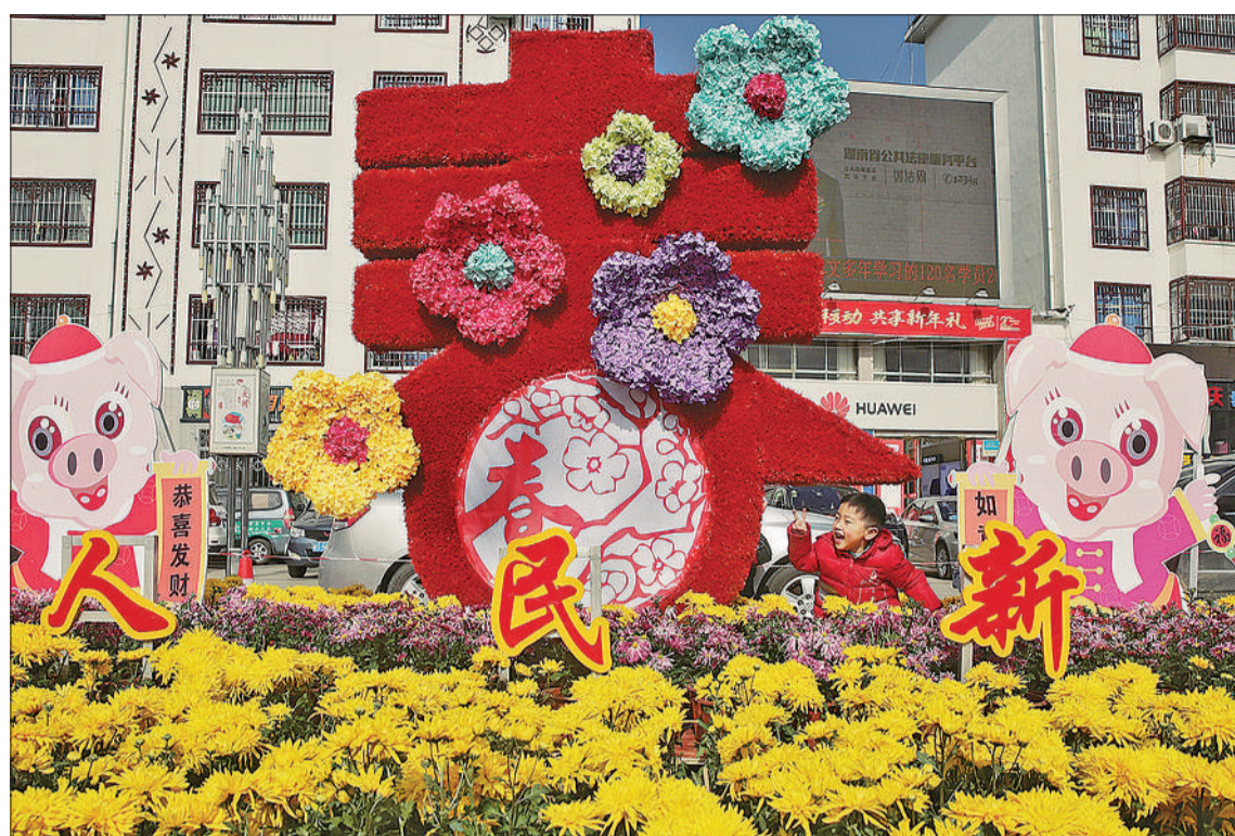
▲湖南省桂东县城罗霄广场，数万朵怒放的鲜花构成迎春美景，洋溢着喜迎佳节的祥和气氛。