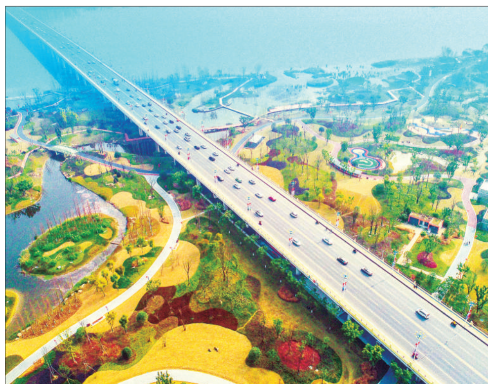
▲四川省遂宁市九莲洲生态湿地公园春节前开园迎客。该公园集生态、观赏、休闲、科普为一体，成为春节期间人们休闲的好去处。

本版主编 李景录 编辑 翟天雪 邮箱 jjrbsyb58392306@163.com