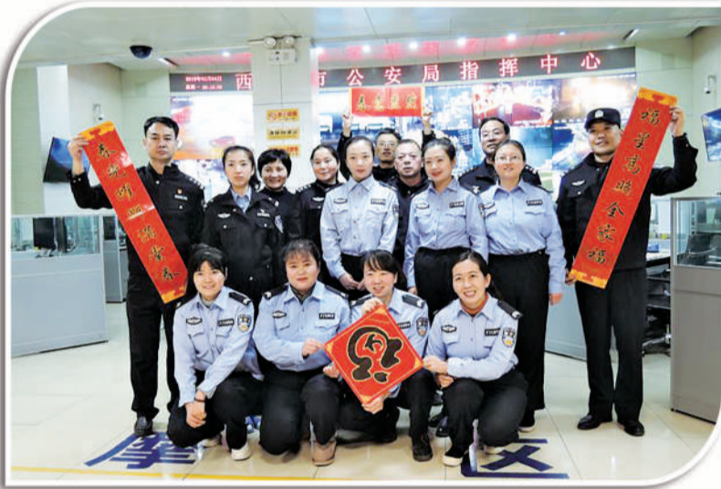
左图 2月4日,青海西宁公安局110指挥中心的值班人员在岗位上迎新春。