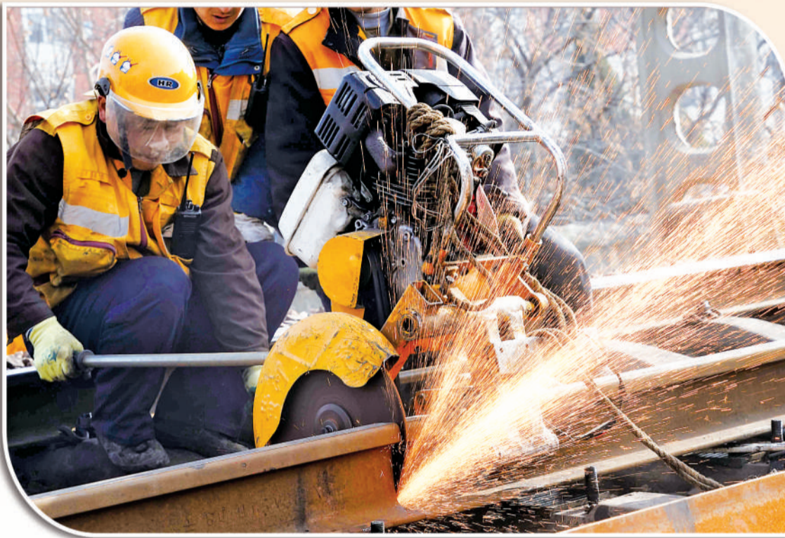
上图 2月5日,中国铁路郑州局集团有限公司郑州桥工段的职工在切割钢轨。