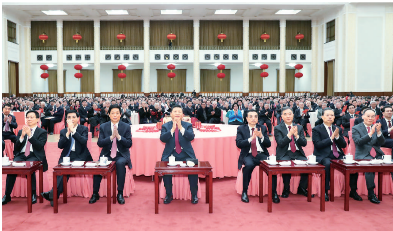
2月3日，中共中央、国务院在北京人民大会堂举行2019年春节团拜会。中共中央总书记、国家主席、中央军委主席习近平发表讲话。