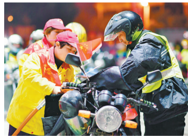
1月21日，骑车返乡的外来务工人员在一处“爱心驿站”免费加油。当日，在福建省福州、泉州、厦门、漳州等地，500多名外来务工人员骑摩托车踏上返乡路。