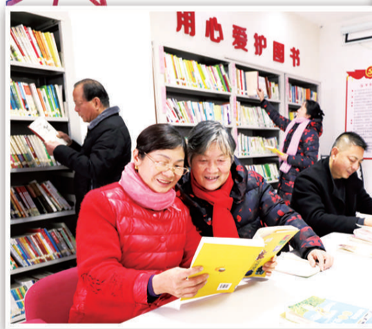
上图 1月20日，江西省宜春市新昌镇桂花社区群众在农家书屋看书。春节期间，农家书屋将成为人们享受“文化大餐”的好去处。