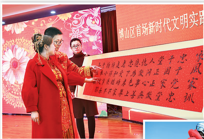
左图 1月23日，在山东省淄博市博山区洪山口村，一对新婚夫妇正诵读家风家训。近日，博山区启动新时代文明实践系列活动，其中之一是为春节期间办婚礼的新人举办集体婚礼、诵读家风家训。