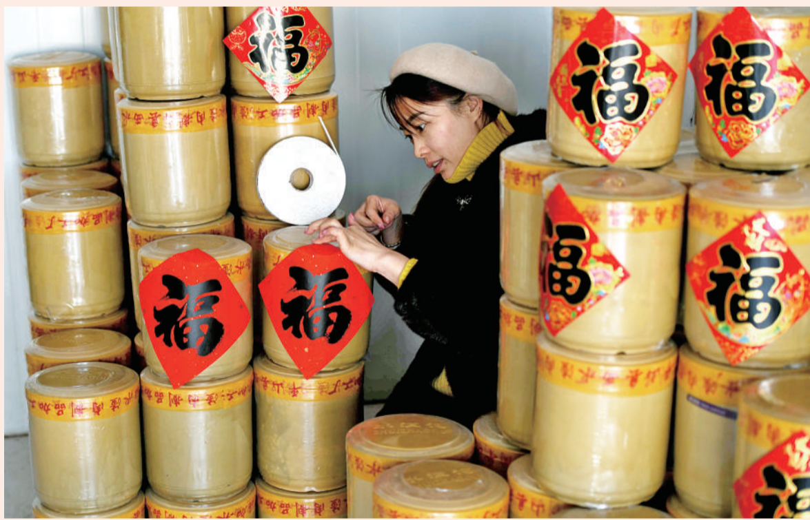
左图 1月23日,山东临沂市费城街道一家企业的工作人员在整理晾晒腊肠。春节临近,不少企业都在赶制腊肠、腌肉等传统风味食物,供应节日市场。