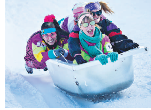
一场别开生面的浴缸滑雪赛日前在瑞士阿尔卑斯山区的施图斯镇举行, 约100支队伍参加了比赛。图为人们参加浴缸滑雪赛。