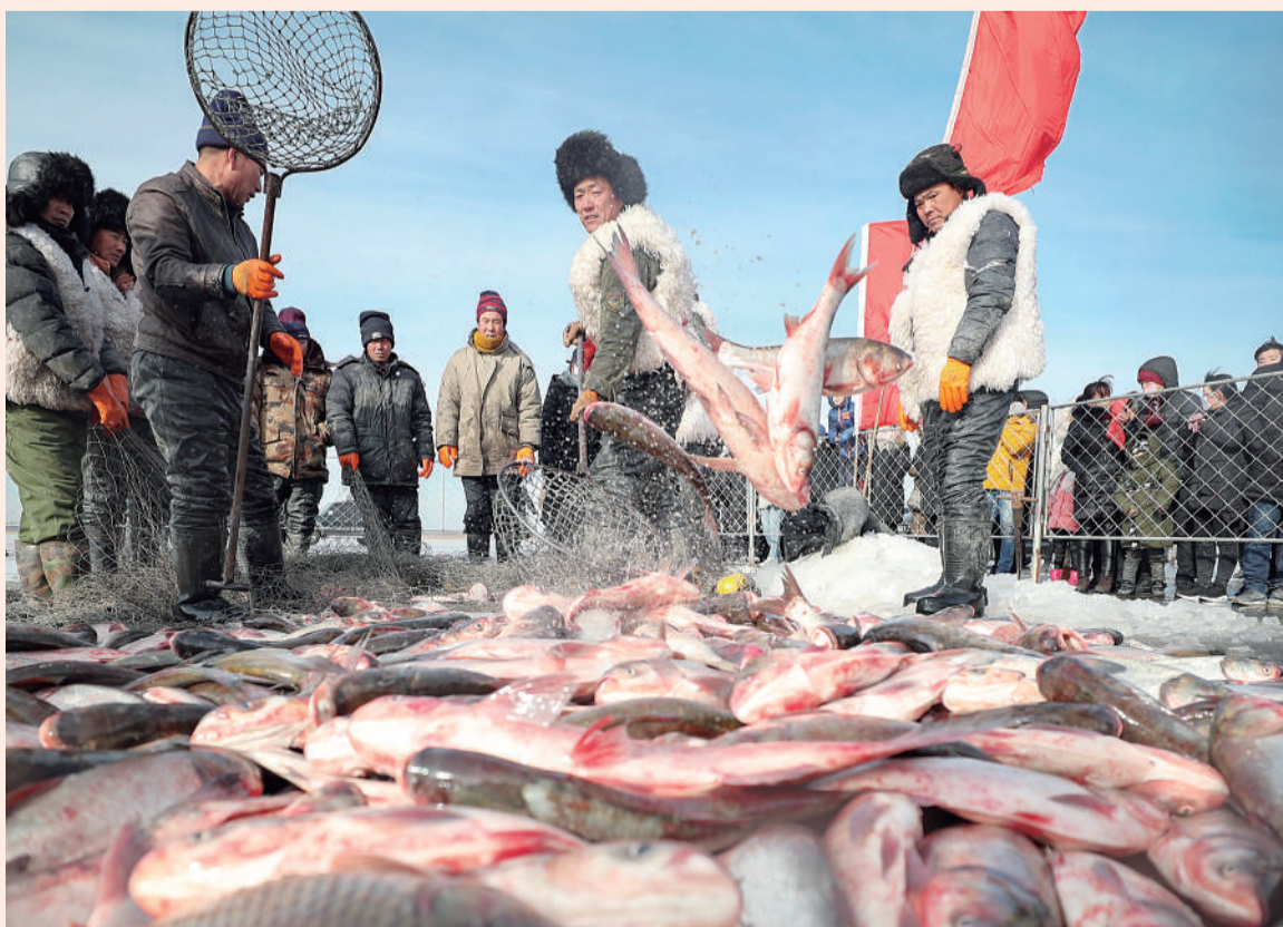
右图 1月19日，渔民在卧龙湖冰面上捕鱼。当日，辽宁康平县冬捕节展示的传统古法捕鱼等内容，吸引了不少游客前来观看。