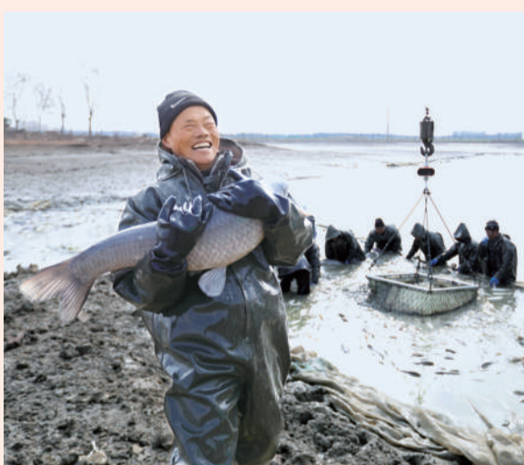
上图 1月16日，江苏省泗洪县青阳街道一处养殖塘口，养殖户正在拉网捕鱼，准备供应节日市场。

主要行业盈利情况方面，统计显示，2018年，石油石化、钢铁等行业利润同比大幅增长，均高于收入增长幅度。“从全年国有企业运行情况看，能源、钢铁等行业发展状况良好，反映出我国经济虽然面临较大下行压力，但拥有足够的韧性，保持了总体平稳、稳中有进。”白景明表示。