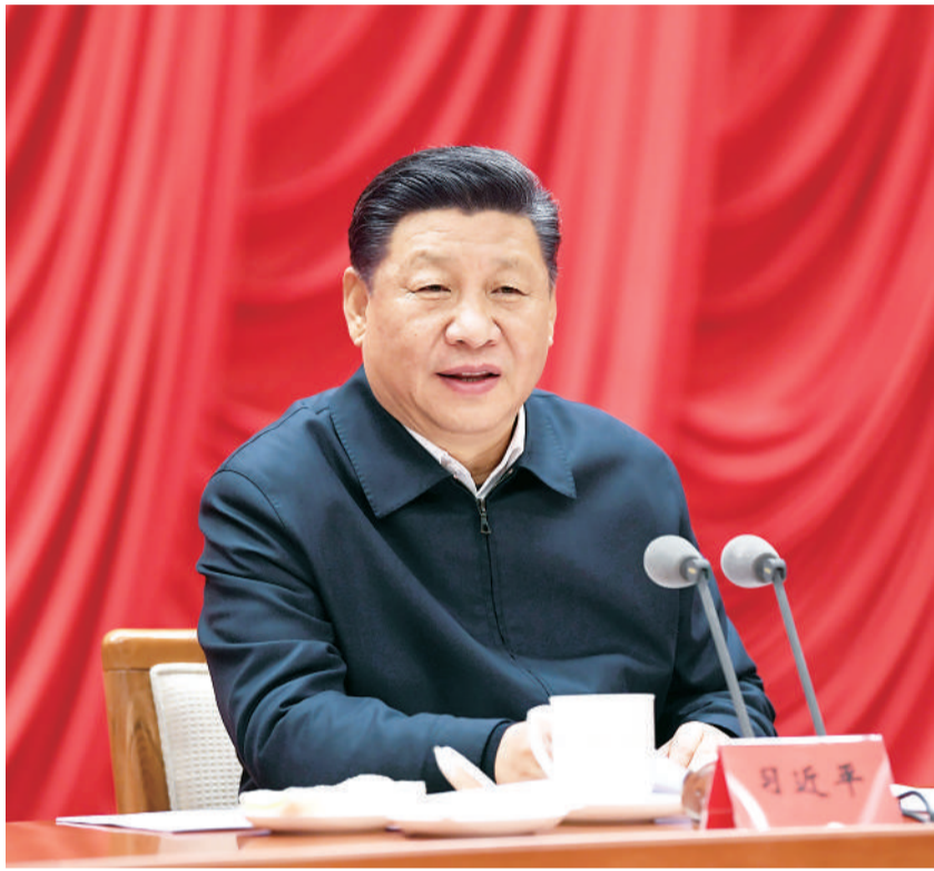
1月21日,省部级主要领导干部坚持底线思维着力防范化解重大风险专题研讨班在中央党校开班。中共中央总书记、国家主席、中央军委主席习近平在开班式上发表重要讲话。

防范化解重大风险,是各级党委、政府和领导干部的政治职责,大家要坚持守土有责、守土尽责,把防范化解重大风险工作做实做细做好。要强化风险意识,常观大势、常思大局,科学预见形势发展走势和隐藏其中的风险挑战,做到未雨绸缪。要提高风险化解能力,透过复杂现象把握本质,抓住要害、找准原因,果断决策,善于引导群众、组织群众,善于整合各方力量、科学排兵布阵,有效予以处理。领导干部要加强理论修养,深入学习马克思主义基本理论,学懂弄通做实新时代中国特色社会主义思想,掌握贯穿其中的辩证唯物主义的世界观和方法论,提高战略思维、历史思维、辩证思维、创新思维、法治思维、底线思维能力,善于从纷繁复杂的矛盾中把握规律,不断积累经验、增长才干。要完善风险防控机制,建立健全风险研判机制、决策风险评估机制、风险防控协同机制、风险防控责任机制,主动加强协调配合,坚持一级抓一级、层层抓落实。