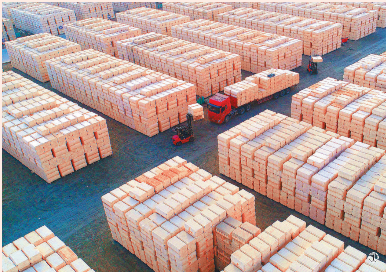
图① 1月16日,在新疆铁门关市二十九团永兴公司,8万余吨优质皮棉正在装运外销。2018年,新疆棉花种植面积达3700多万亩,占全国棉花种植面积的80%。