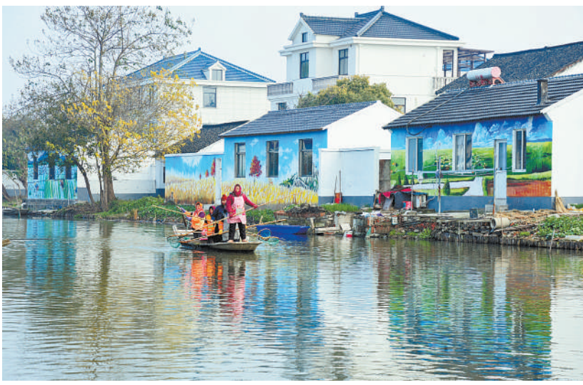
江苏省太仓市双凤镇勤力村乡村河道保洁人员清捞侯巷河河道水面垃圾。与河岸农户屋后五颜六色的墙绘画构成一幅船在画中游的美景。

农业农村部科技教育司司长廖元介绍，各地全面推进以新型职业农民为主体的农村实用人才评价认定，目前全国新型职业农民总量已达到1500万人，占农村实用人才的75%。农业农村部、科技部出台促进科技成果转化细