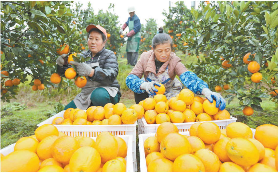
贵州省赤水市旺隆镇永兴村果农在收获脐橙。近年来，赤水市旺隆、长沙、石堡等乡镇党员干部引导农户种植和改良优质脐橙，使之成为当地农户增收脱贫的“致富果”。

不仅单项产业有突破，乡村产业集群也在大量涌现。各地推进要素聚集、功能集合，打造产业链条首尾相连的产业园区。江西省永丰县按照“产业园区化”的理念，从完善基础设施条件入手，推动各产业基地向现代农业园区迈进，引导其连线成串。目前该县已形成永吉线现代农业示范区、永鹿线特色产业示范区、抚吉高速富民产业示范区等3